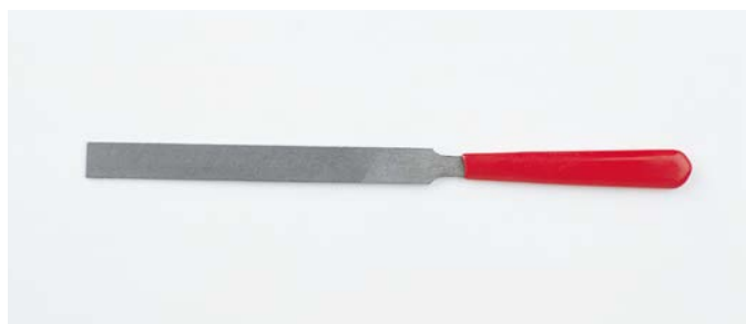
規格表 STANDARD TABLE