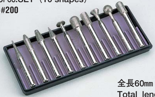
全長60mm Total length